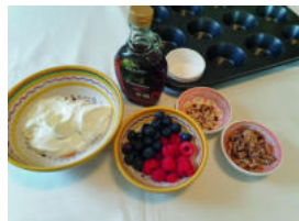
Zutaten für das Eis