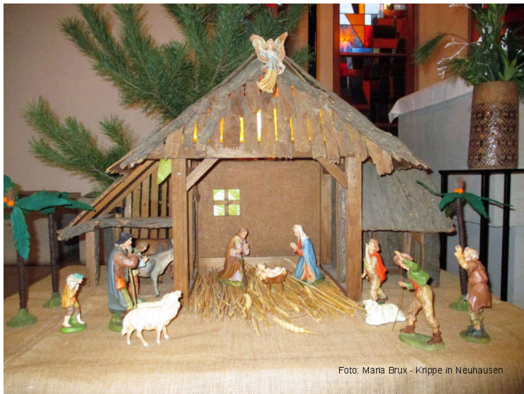
Krippe in Neuhausen