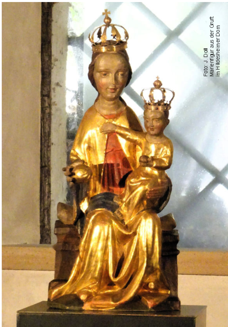
Marienfigur aus der Gruft im Hildesheimer Dom